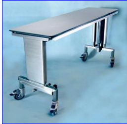
Deutsches Patent Nr. 34 14 551