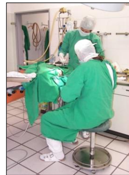
Deutsches Patent Nr. 34 48 512